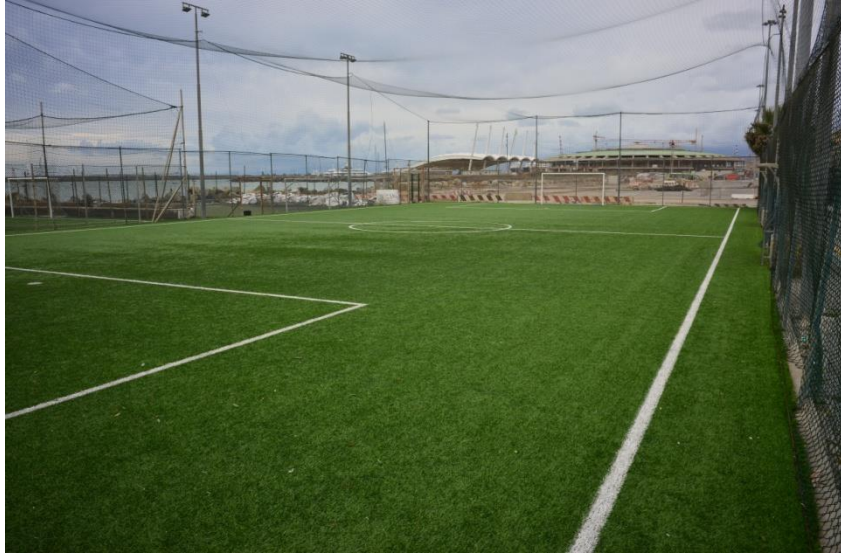
campi da calcio a 5